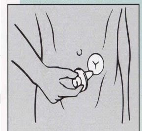
Modalidad de Uso del Dilatador DILASTOM